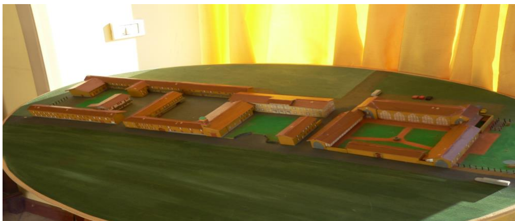
Plastico della cascina " La Poglianasca ". La Ca' luigi è sulla destra.